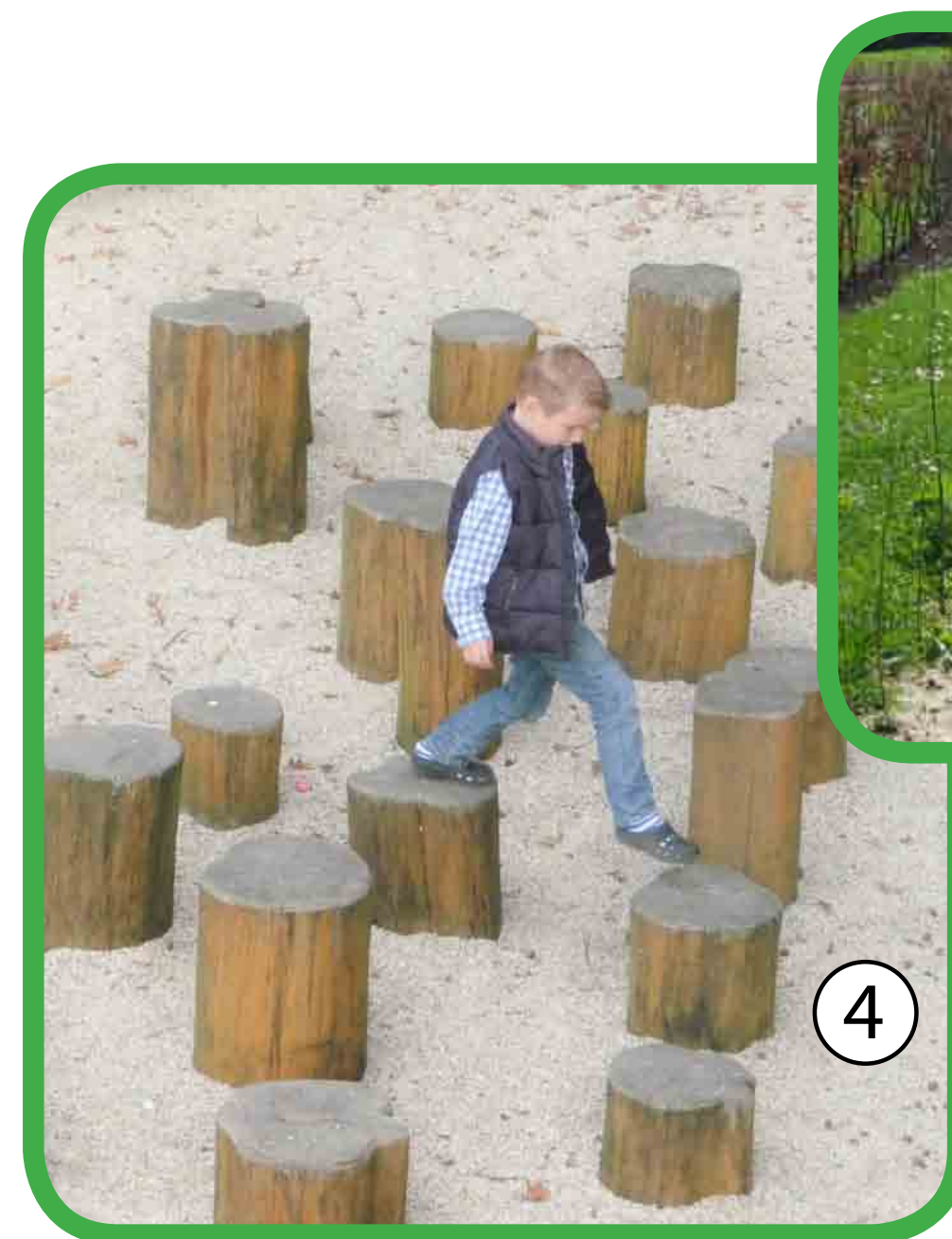
[4] Zit- en stapstammen