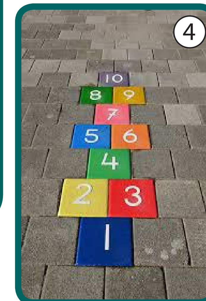
Voorbeeld van Hinkeltegels