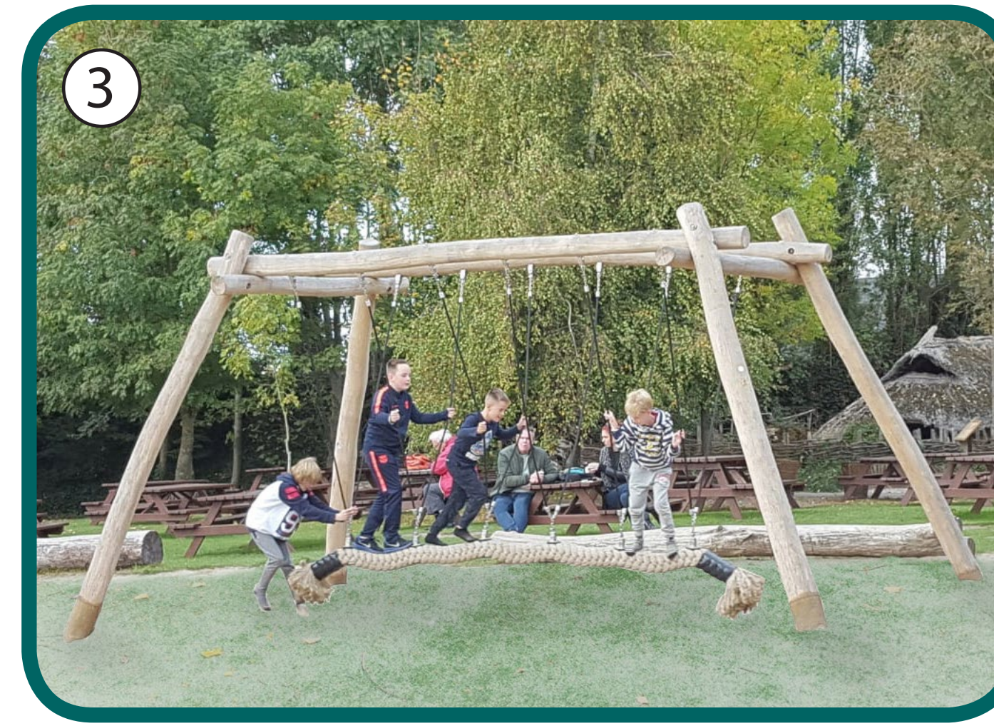
Referentie CocoWave Schommel