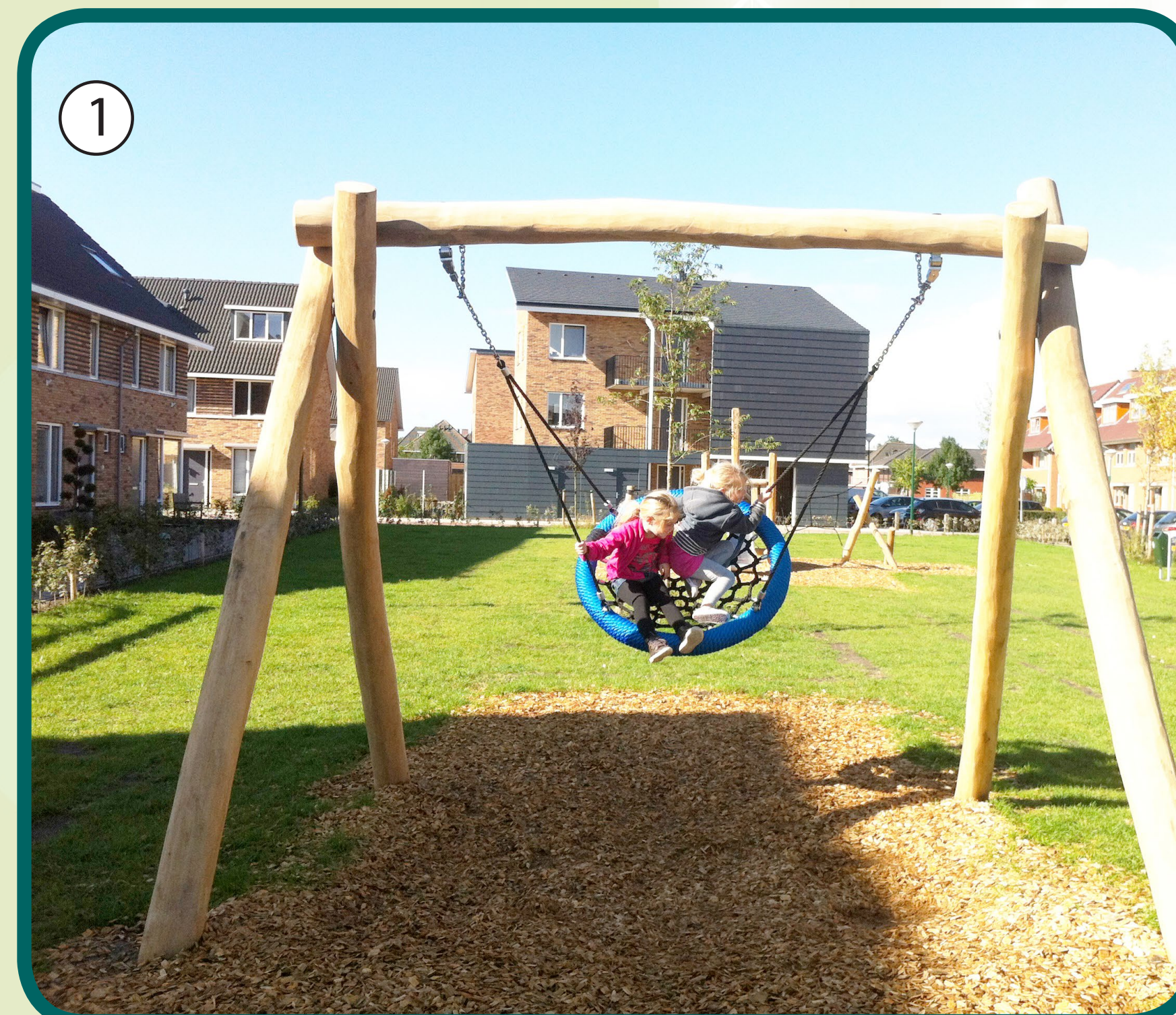
Referentie Speeltoren met glijbaan