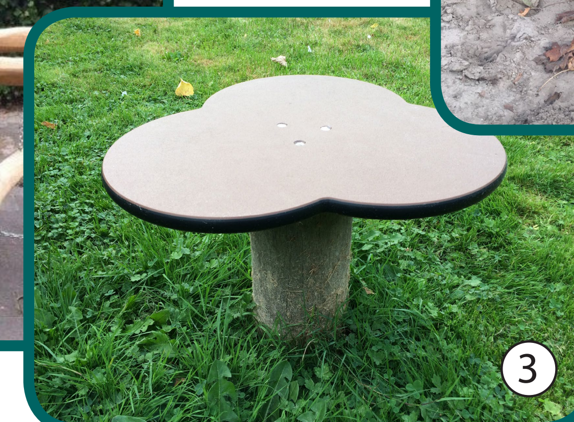
Referentie Stapelement 'Bloem'