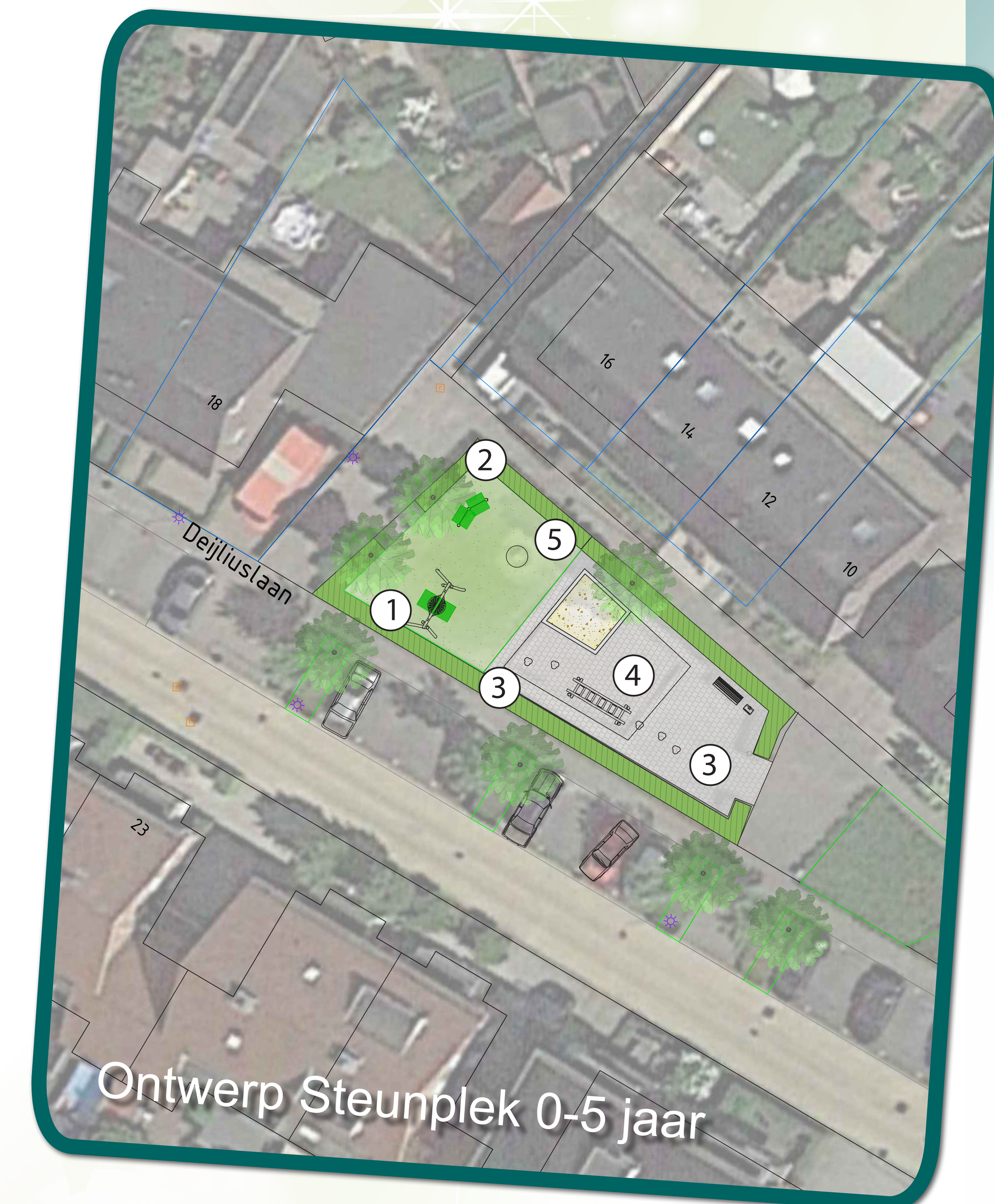
Ontwerp Steunplek 0-5 jaar